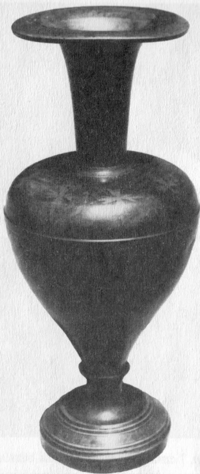
5. kép. Lenkey Károly ezredes vázája. Egerben élő leszármazott tulajdonában.