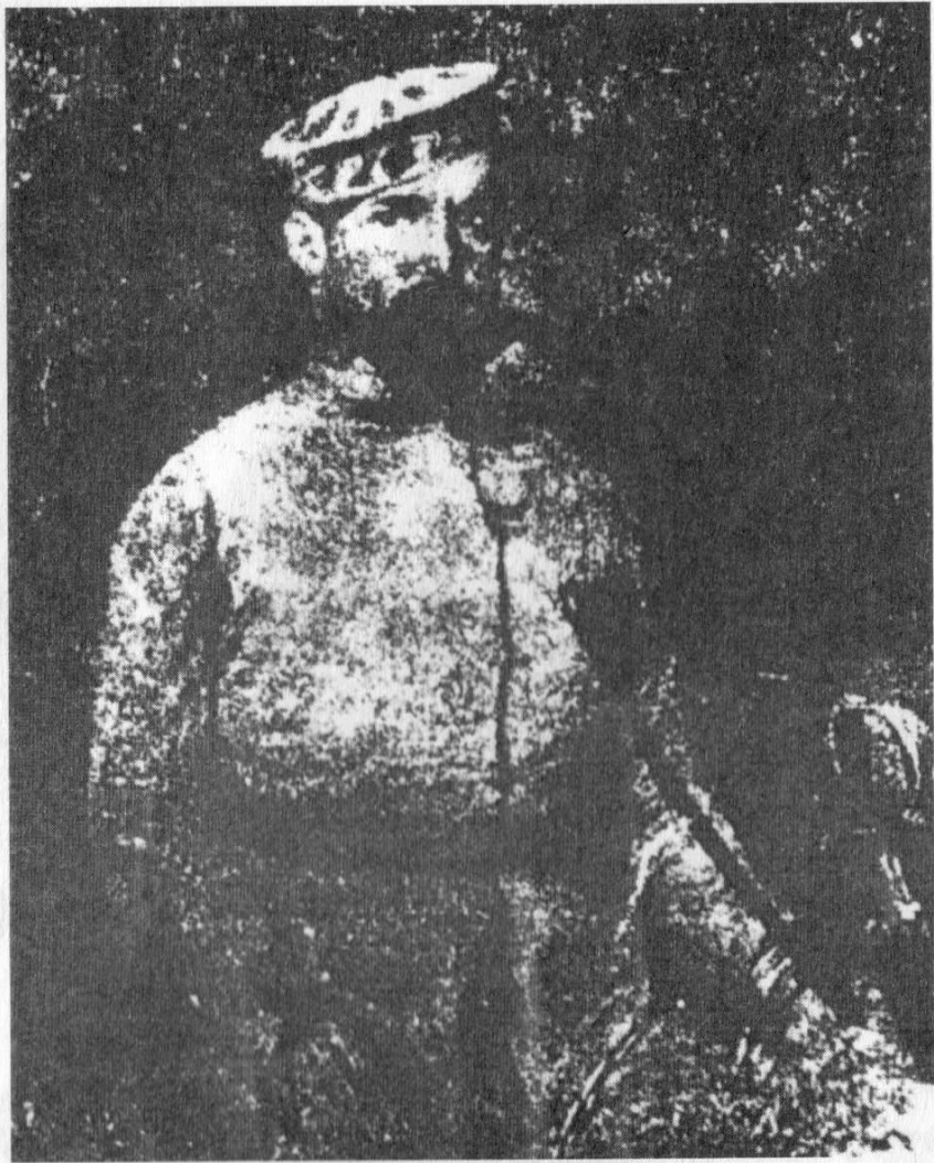
4. kép. Lenkey Károly az aradi börtönben. Kovács Mihály elveszett festménye.