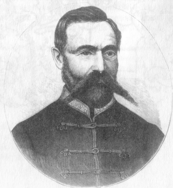
3. kép. Lenkey Károly időskori mellképe 1874-ből. Vasárnapi Újság, 1874. május 31.