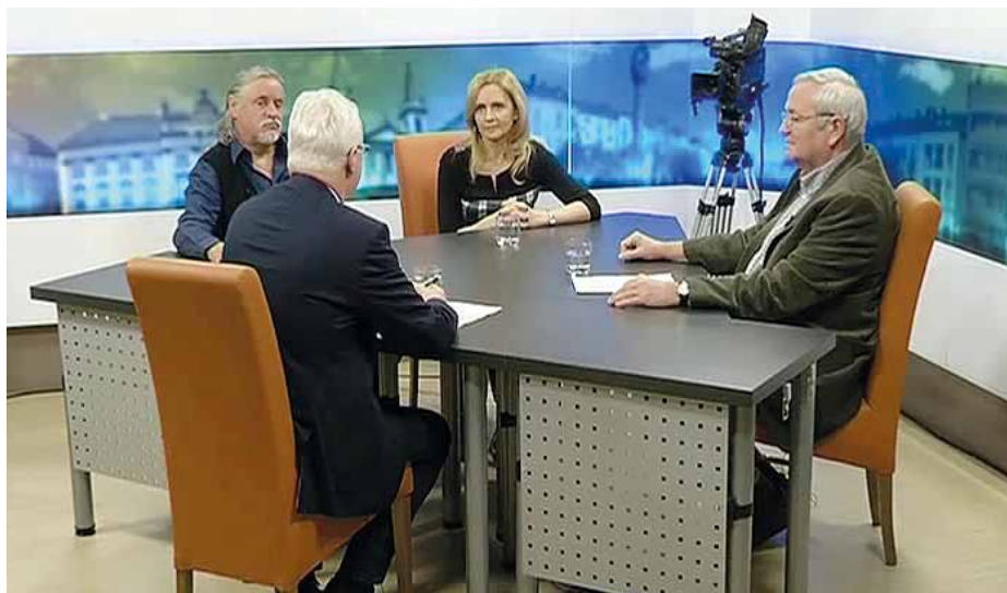
AZ ELSŐ MŰSORBAN ŐK „TALÁLTÁK KI” SZOMBATHELYT

Érdekes történeteiket mesélték el és javaslatukat is megfogalmazták a Szombathelyi Televízió műsorának vendégei, akiket számtalan élmény köt a városhoz.