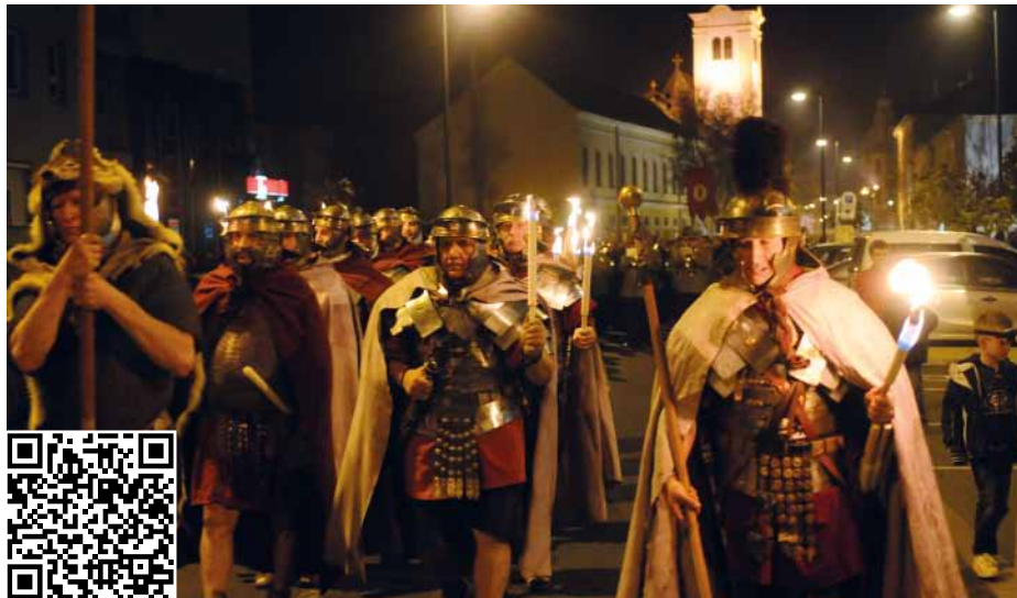
A LEGIÓSOK VEZETTÉK FEL A LAMPIONOS FELVONULÁST

Szent Márton ünnepén a Székesegyházban tartott vesperás után lampinos felvonulás kezdődött. A korábbi évek hagyományainak megfelelően ezúttal is több százan vonultak a Szent Márton-templomhoz.