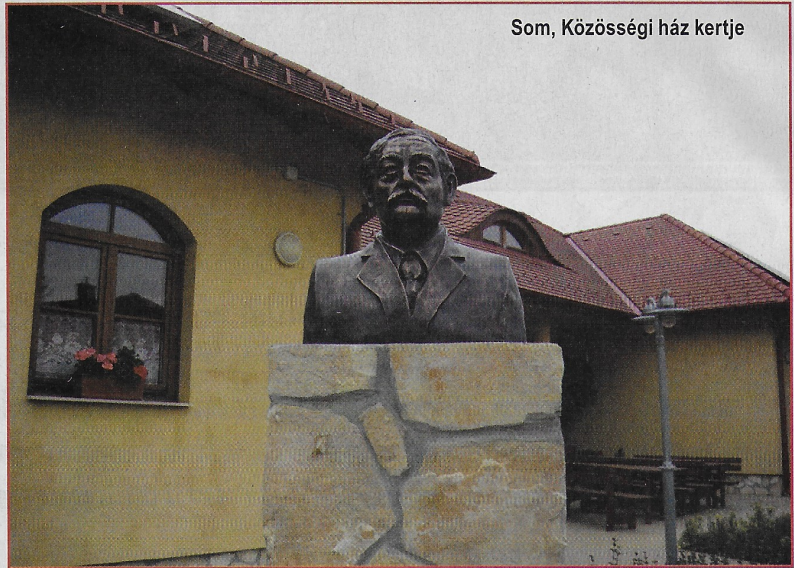
Som, Községi ház kertje