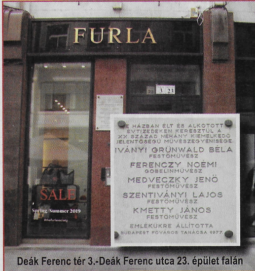
Deák Ferenc tér 3.-Deák Ferenc utca 23. épület falán

Párizsba, a Julian Akadémiára, 1891-ben vissza Münchenbe. 1896-ban Nagybánya, a Művésztelép egyik alapítója lett. 1899-ben feleségül vette Bilcz Irént. 1902-ben született István Béla fiúk. Grünwald Béla termékeny művész volt. 1911 őszén elindult a