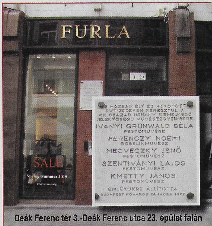
Deák Ferenc tér 3.-Deák Ferenc utca 23. épület falán