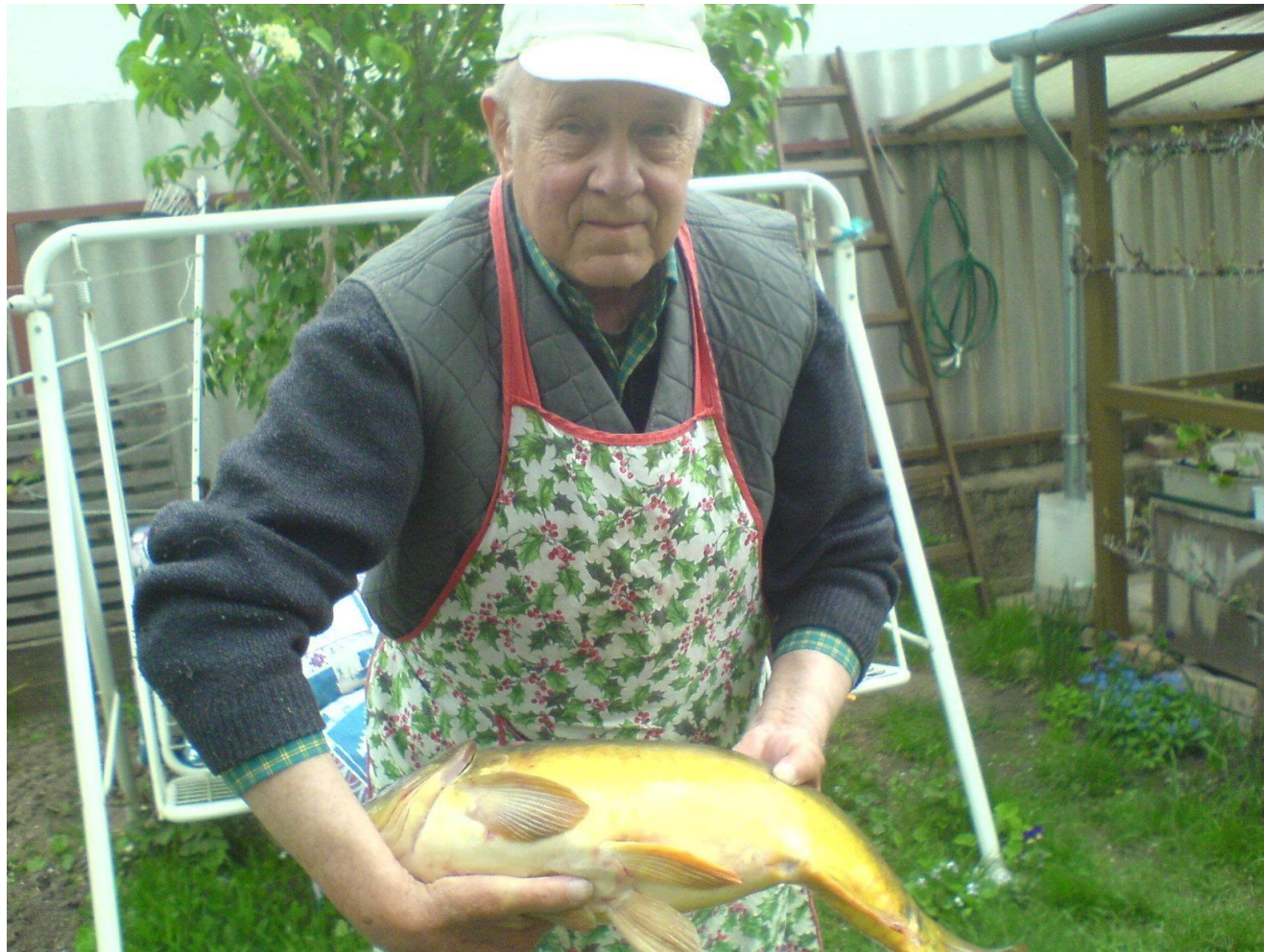
Méltán büszke a fogásra