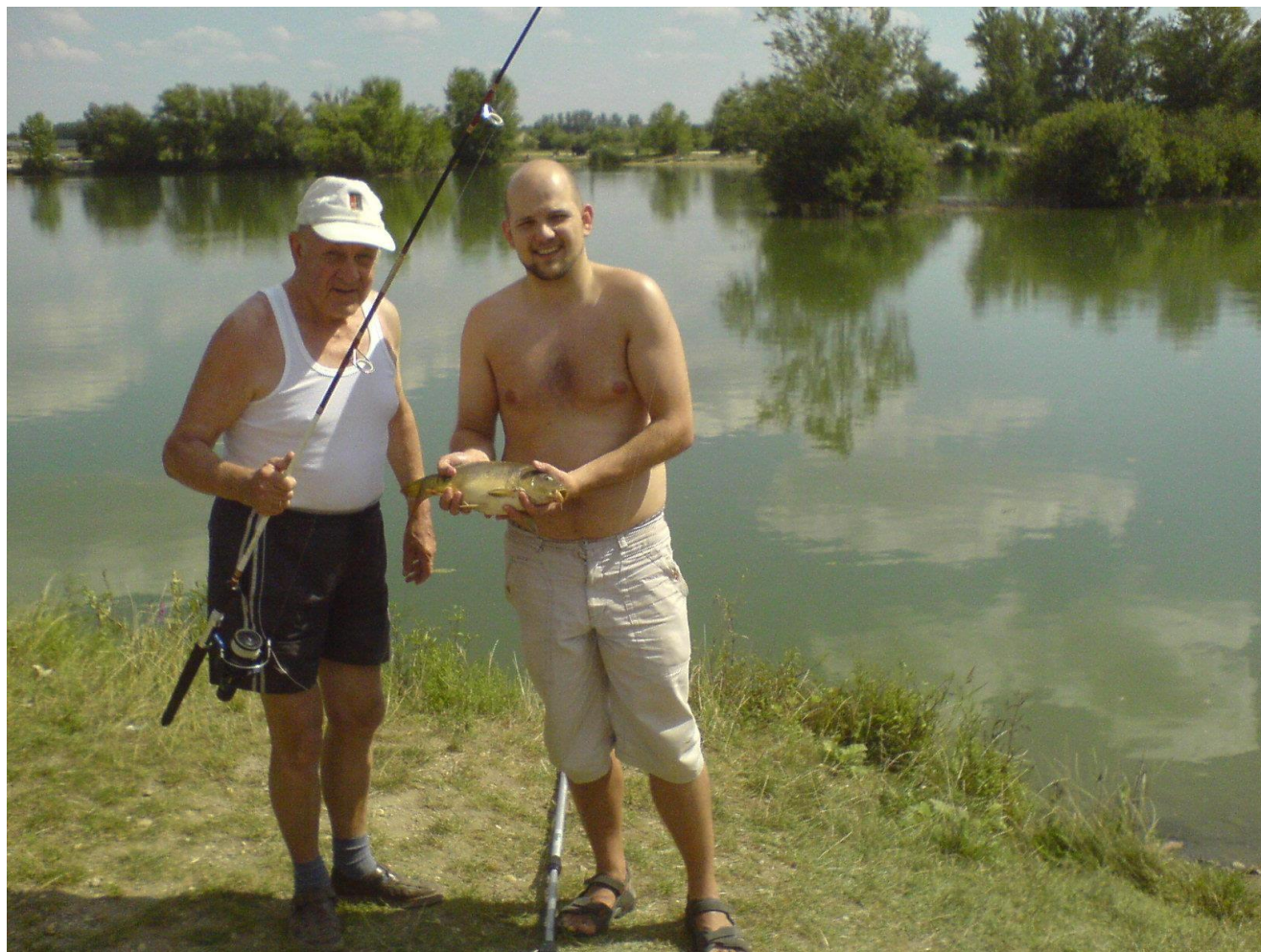
A két László horgászat közben